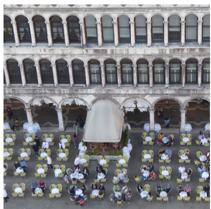
4 Cafe von oben